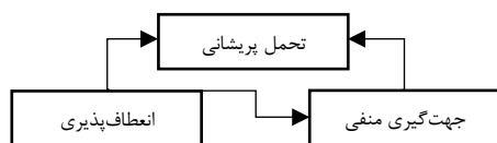
نمودار (۱) مدل پيش فرض جهت گيري منفي به عنوان يك عامل ميانجي در ارتباط بين انعطاف پذيري شناختي و تحمل پريشاني

بيروني و ناپايدار نسبت مي دهد و بر عكس رويدادهاي ناگوار و نامطلوب را به عوامل دروني و پايدار نسبت مي دهد و در نتيجه منجر به بروز افسردگي در فرد مي شود (۲۵). با توجه به ارتباط نظري و پژوهشي بين متغيرها، الگوي پيش فرض ارتباط بين پريشاني و جهت گيري منفي به مشكل را مي توان با استفاده از شكل شماره يك نمايش داد. با توجه به اينكه انعطاف پذيري شناختي عامل مهم در حل ناكارآمدي در برابر مشكلات و بروز برخي اختلالات رواني شناسايي شده است (۲۶ و ۲۷) بنابراين شناخت بيشتر در اين زمينه مي تواند در پيشگيري و درمان آسيب هاي احتمالي كه متوجه نوجوانان بي سرپرست و بدسرپرست است، موثر باشد. پژوهش حاضر با در نظر گرفتن اهميت موضوع، به بررسي رابطه بين انعطاف پذيري شناختي و تحمل پريشاني با ميانجگيري جهت گيري منفي به مشكل در نوجوانان بي سرپرست و بدسرپرست مي پردازد.